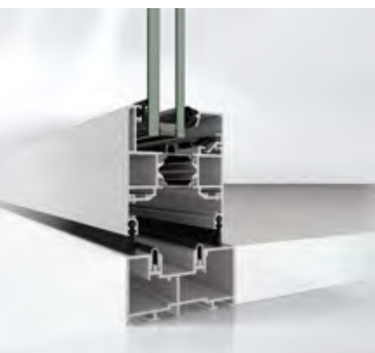
Schüco ASS 70 FD in HD-Ausführung Schüco ASS 70 FD in HD design